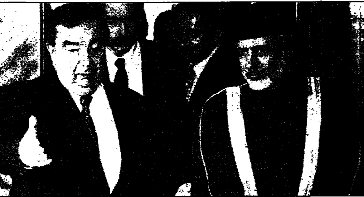
وزير الخارجية السعودي يوسف بن علي وولي العهد السعودي فهد بن عبد العزيز...